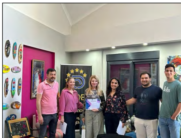
Primirea diplomei de participare din partea staff-ului Cekdev International Education and Development Academy

O bibliotecă fără atributul comunicării publice nu poate exista, cel puțin în zilele noastre. Aceasta reprezintă o prezentare, o expunere făcută de o persoană în fața unui auditoriu și poate viza transmiterea unor