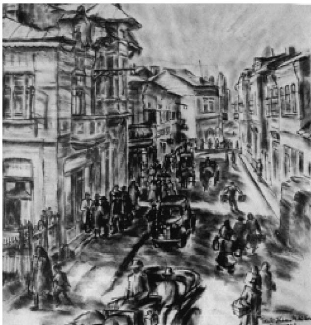
Tanți Iliescu Mihăilescu Centrul vechi